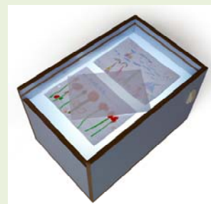
Caja de la luz y el color

CON LA COMPRA DE MOBILIARIO DE LA LÍNEA ACENTO , OS ENTREGAREMOS NUESTRA MEMORIA USB DE CONTENIDOS PEDAGÓGICOS