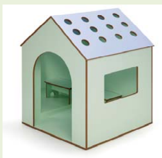
Casa de los contrastes

Entra en www.equipamientosymobiliarioinfantil.com (líneas de equipamiento) y descubre toda nuestra oferta (te ponemos tres ejemplos):