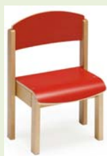
Silla maciza de madera

Entra en www.equipamientosymobiliarioinfantil.com (líneas de equipamiento), para analizar todos los contenidos (te ponemos unos ejemplos):