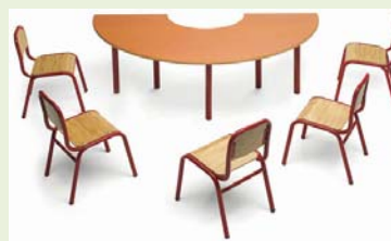
Mesa semicircular con sillas

¿Quieres conocer los artículos de las líneas de SALVADEDOS ?