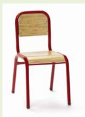
Silla metálica con estratificado